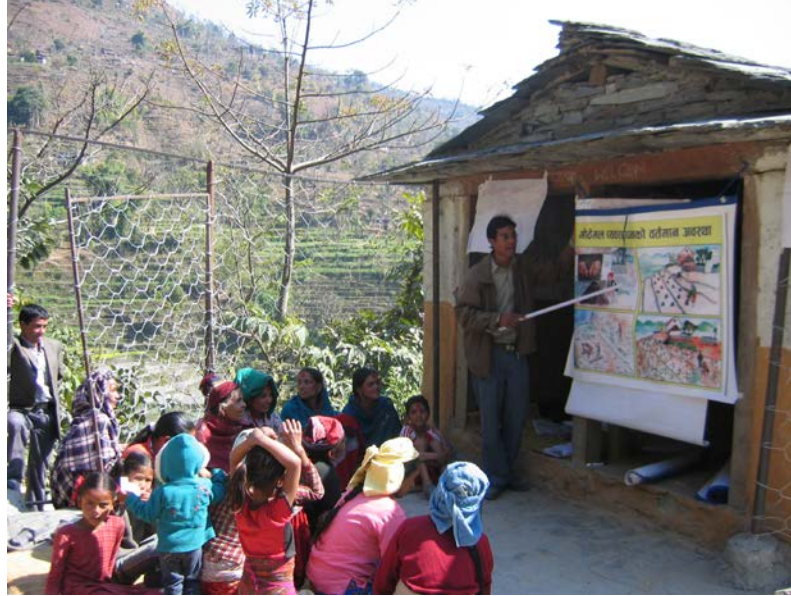
गोठेमल व्यवस्थापन तालिम र कालो प्लास्टिकको प्रयोगद्वारा छिटो मल वनाउने प्रविधि

रासायनिक मल तथा विषादीको प्रयोगमा न्युनिकरण गर्दै रसायन रहित ताजा तरकारी उत्पादन वृद्धिका लागि समुह कृषकलाई गोठेमल सुधार, गंहुतको सदुपयोग, कम्पोष्टमल निर्माण र जैविक विषादी निर्माण तथा प्रयोग सम्बन्धी घरगोठमा नै प्रयोगात्मक अभ्यास सहितको तालिम दिइयो ।