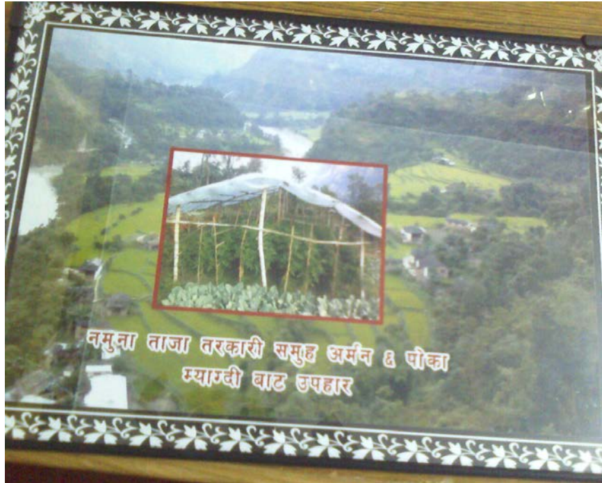
विदाईमा मायाको चिनो

कृषक समुहद्वारा संस्थालाई कार्यक्रम समापनमा गरेको विदाईमा दिएको चिनो ।