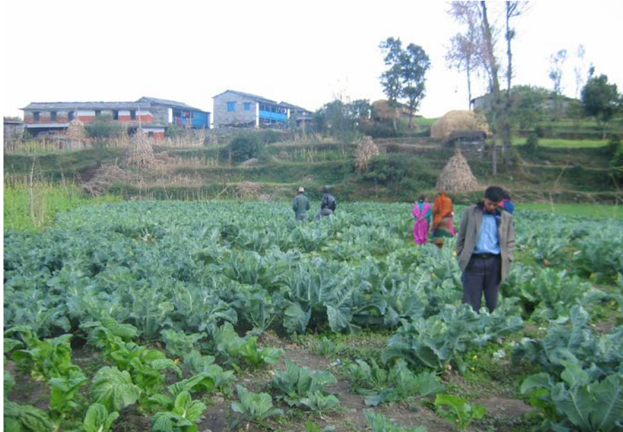
आयोजनाको अनुगमन तथा मूल्याङ्कन गर्दै संस्थाका प्राविधिक

कृषकहरुद्वारा स्व.अनुगमन, संस्थाका कर्मचारीद्वारा नियमित Follow up, र जिल्ला कृषि विकास कार्यालय म्याग्दी तथा कृषि सेवा केन्द्रद्वारा प्राविधिक सहयोग हुने गरी अनुगमन नियमित रुपमा गरिएको थियो । चौमासिक रुपमा कृषकको खेतवारीमा नै गएर अनुगमन गरी उक्त अनुगमन गर्दा देखिएका कमि कम्जोरी सुधार गर्न कृषक तथा संस्थाका फिल्ड कर्मचारीलाई सुझाव सल्लाह दिईएको थियो ।